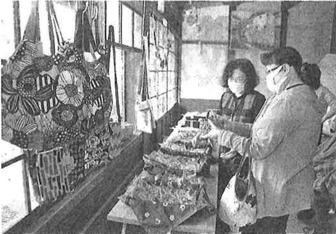
バッグやアクセサリーなど手作りの作品を手にする来店客 美馬市脇町の森邸

美馬市シルバー人材センターは、地域のにぎわいや女性会員同士の交流の場づくりにつなげようと、同市脇町のうだつの町並みに、4月から月2回、女性会員が制作した小物などを並べた「手づくりの店」を開いている。センターの認知度向上を図り、女性会員の増加を目指す。