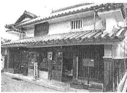
月2回「手づくりの店」が開かれる森邸 美馬市脇町のうだつの町並み